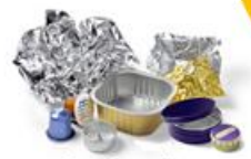
Capsules café, Bougies chauffe-plat, Barquettes, Boîtes et Feuilles