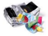
Sachets café Poches de compote