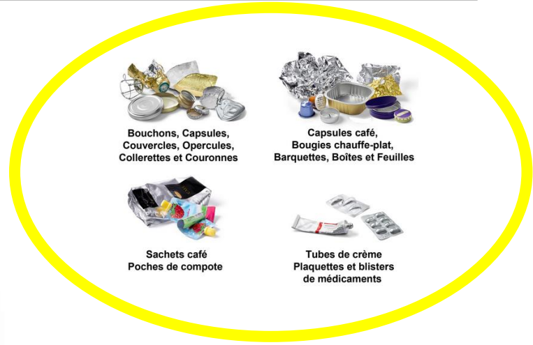
Bouchons, Capsules, Couvercles, Opercules, Collerettes et Couronnes